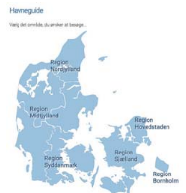
Oversigt over lystbådehavne. Screenshot

Man kan også se, hvilke seværdigheder man kan se og opleve under sit ophold i havnen.