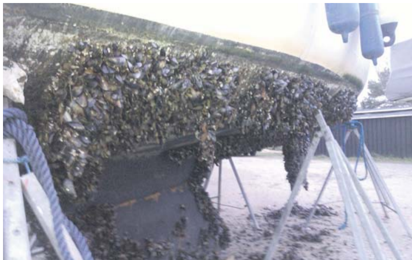
Hvis du ikke anvender en god maling, kan du her se, hvor begroet bunden kan blive, og så har du et endnu større stykke arbejde forude.