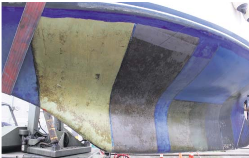
Efter et år kan man her se, at der er stor forskel på virkningen af de forskellige bundmalinger.

Da vi gjorde klar til årets bundmalingstest, delte vi bådens bund op i passende store felter, så testresultatet blev så korrekt som muligt. Derefter påførte vi bundmaling på samtlige testfelter.