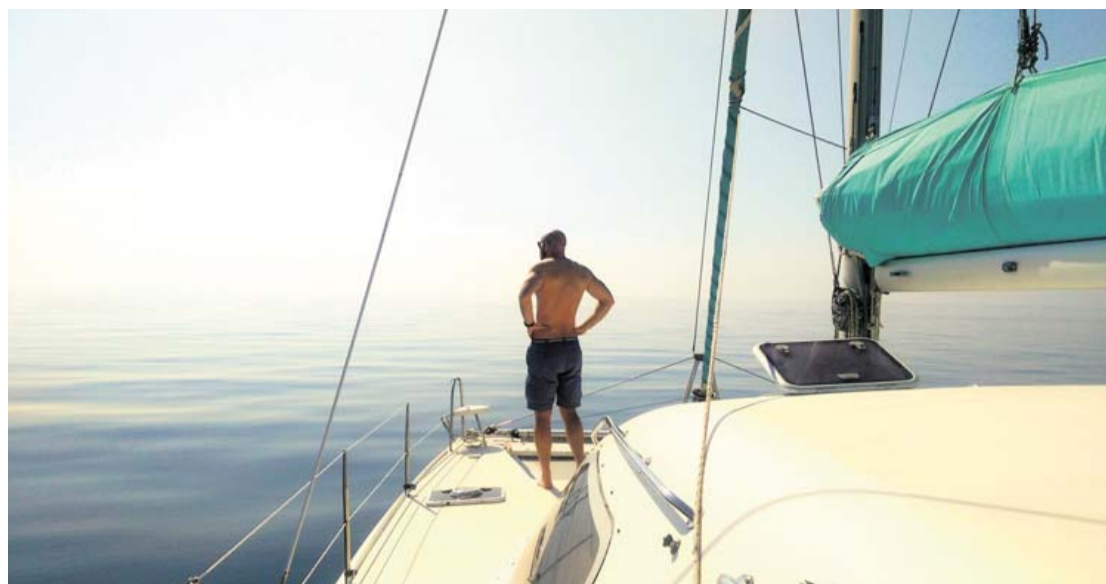
På deres jomfrusejls med Moana sejlede parret fra Hou til Anholt, hvor de smed anker og købte en stor pose jomfruhummere, inden de begav sig videre ned gennem et smukt og vindstille Kattegat, fortæller de.