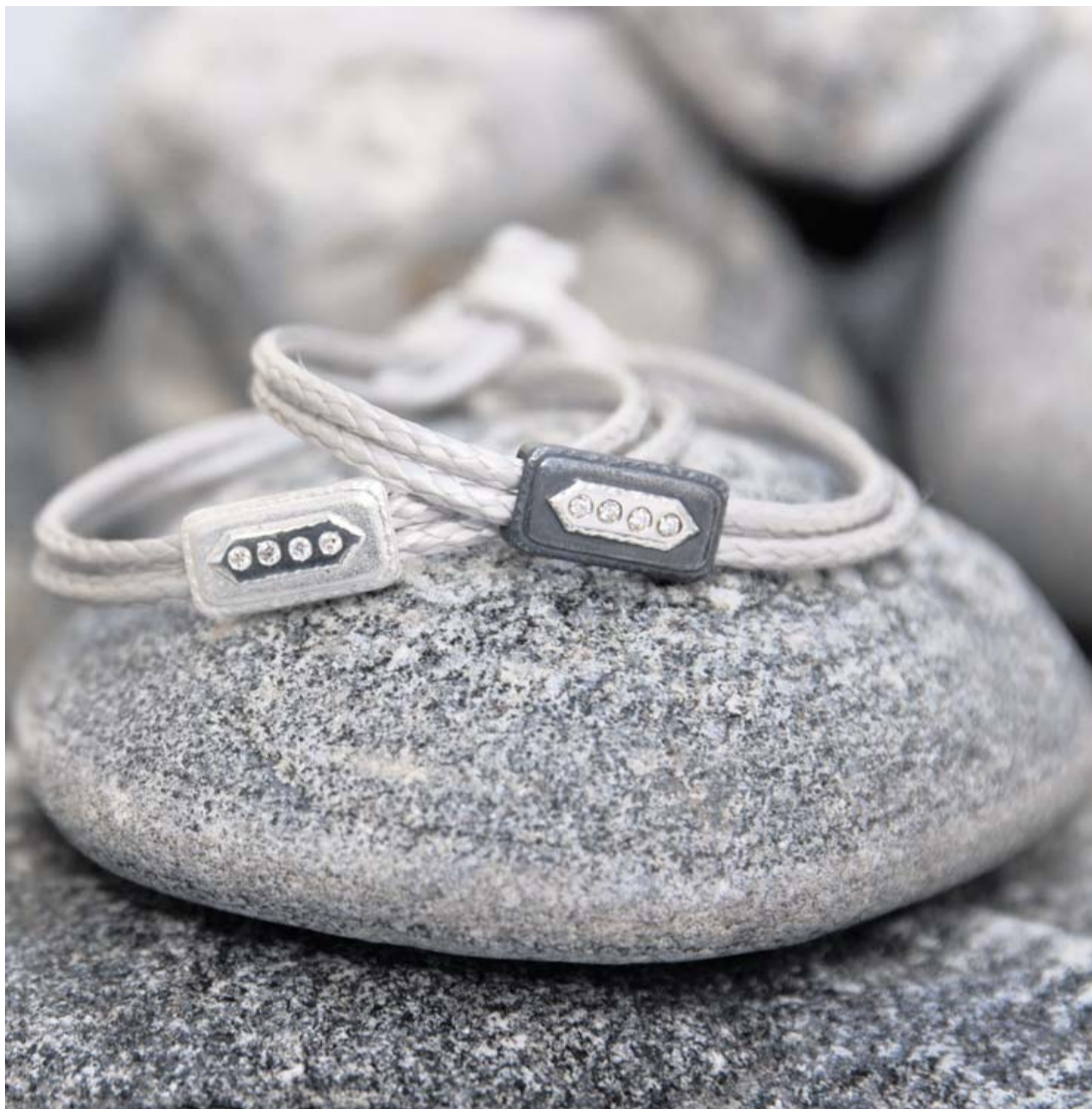
Nots by Heckmann er udført i Sterlingsølv 925, diamanter a 0,03 karat og stærk Dyneematråd.