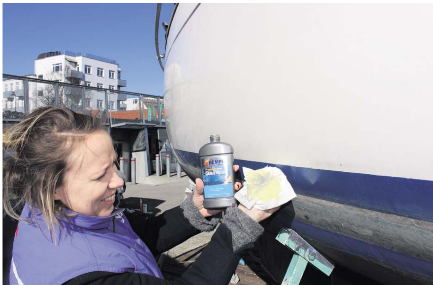
Tiden er kommet til at gøre båden klar til sommeren.